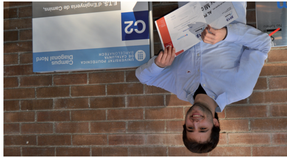
Guanyador del 1r premi dels Premis BASF, edició 2013