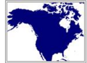
EUA i Canadà